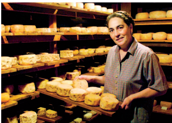
Bäuerliches Handwerk basiert überwiegend auf Erfahrungswissen. Diesen Käse gibt es nicht industriell standardisiert.

Unser herrschender Begriff von Wissenschaft ist von der Naturwissenschaft geprägt. Als wissenschaftlich bewiesen, d. h. als wissenschaftliches Gesetz gilt, was im Experiment unter stets gleichen Messbedingungen zu stets gleichen Ergebnissen führt. Ziel der Erforschung der Naturgesetze ist die Reproduzierbarkeit, ist die unendlich oft wiederholbare Produktion. Nicht die Vielfalt der je unterschiedlichen Landschaften, Klimata und Kulturen steht im Zentrum des Forschungsinteresses, sondern das immer gleich bleibende, überall gleich zu erzielende Ergebnis. So kam es in den 1960er Jahren zum Siegeszug der Grünen Revolution mit den sogenannten Hohertragsorten. Die von den Chemiekonzernen gehandelten Hybridsorten wurden als Bestandteil der internationalen Entwicklungspolitik in der ganzen Welt durchgesetzt, so dass heutzutage nur noch einige wenige Weltmarktsorten und -rassen genutzt werden. In Mexiko sind seit 1930 etwa 80% der Maisorten ausgestorben. Von den 30 000 traditionellen indischen Reissorten werden heute noch fünfzehn angebaut. Weltweit dominieren allein zwei Legehennenlinien. Das ist das Ergebnis ein und derselben Geisteshaltung, nämlich von naturwissenschaftlichem und kapitaldominiertem Denken zugleich.